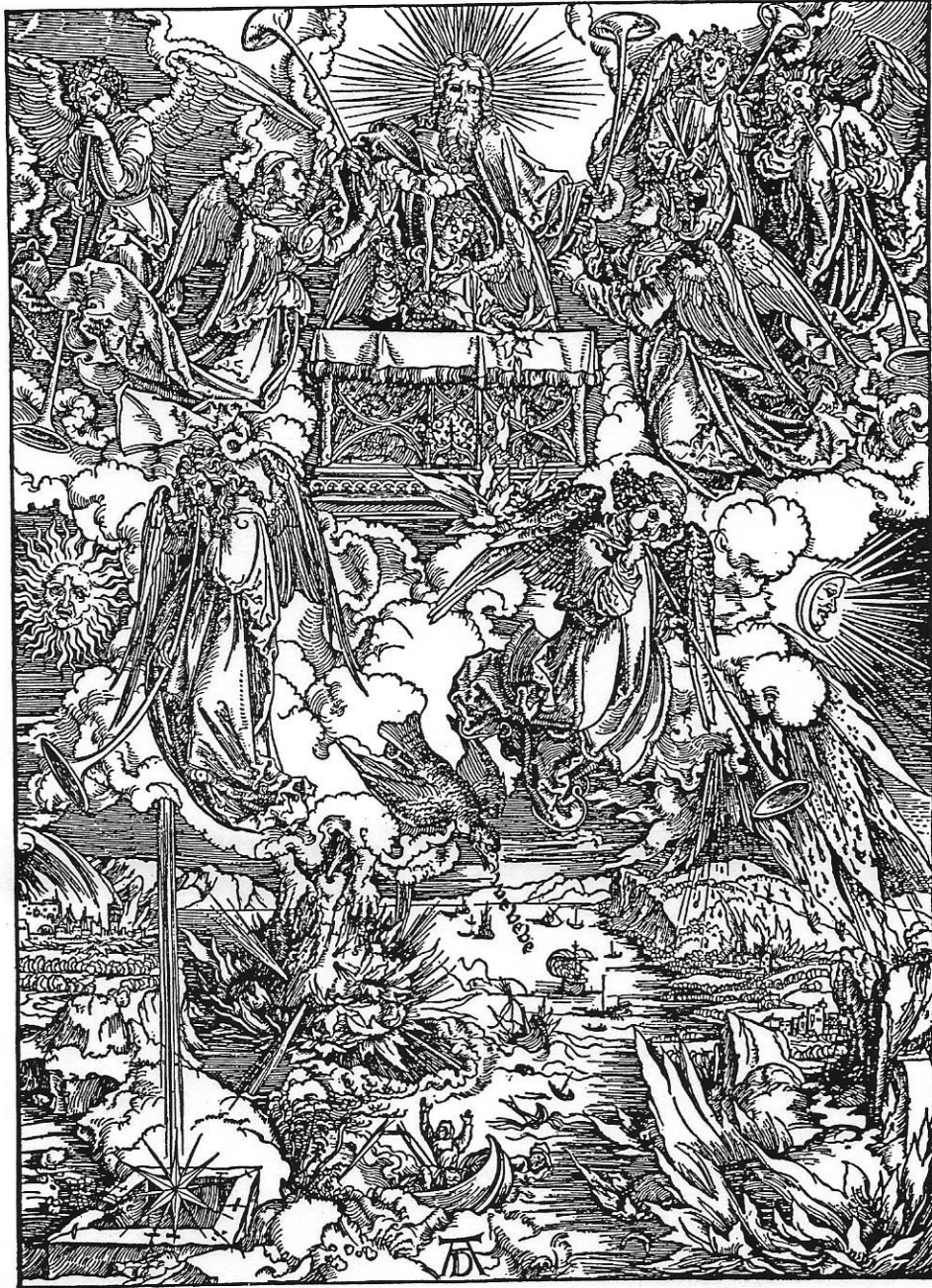
Fig. 12.3 Scenes from Dürer's "Apocalypse" #7

ຮູບພາບໝາຍເລກ 7 ເປັນຮູບພາບທີ່ບັນລະຍາຍພຣະທັມພຣະນິມິດບົດທີ 8 ເຖິງວິບັດຕ່າງ ໆ ພຣະເຈົ້າຊົງເບິ່ງຢູ່ ມີທູດສ່ວນເຈັດຕົນຖືແກ້ໄຂງເຈັດ ມີມືໃຫຍ່ຄູ່ນຶ່ງຜັກມູຫນ່ວຍໃຫຍ່ທີ່ ໄຫມ້ຢູ່ລົງທະເລ ດວງດາວ ໆ ນຶ່ງຕົກ ມີວິບັດອື່ນທີ່ເກີດຂຶ້ນ ຮູບພາບນີ້ຊາວເຢຣະມັນເອີ້ນວ່າ "ວິບັດ ວິບັດ ວິບັດ"