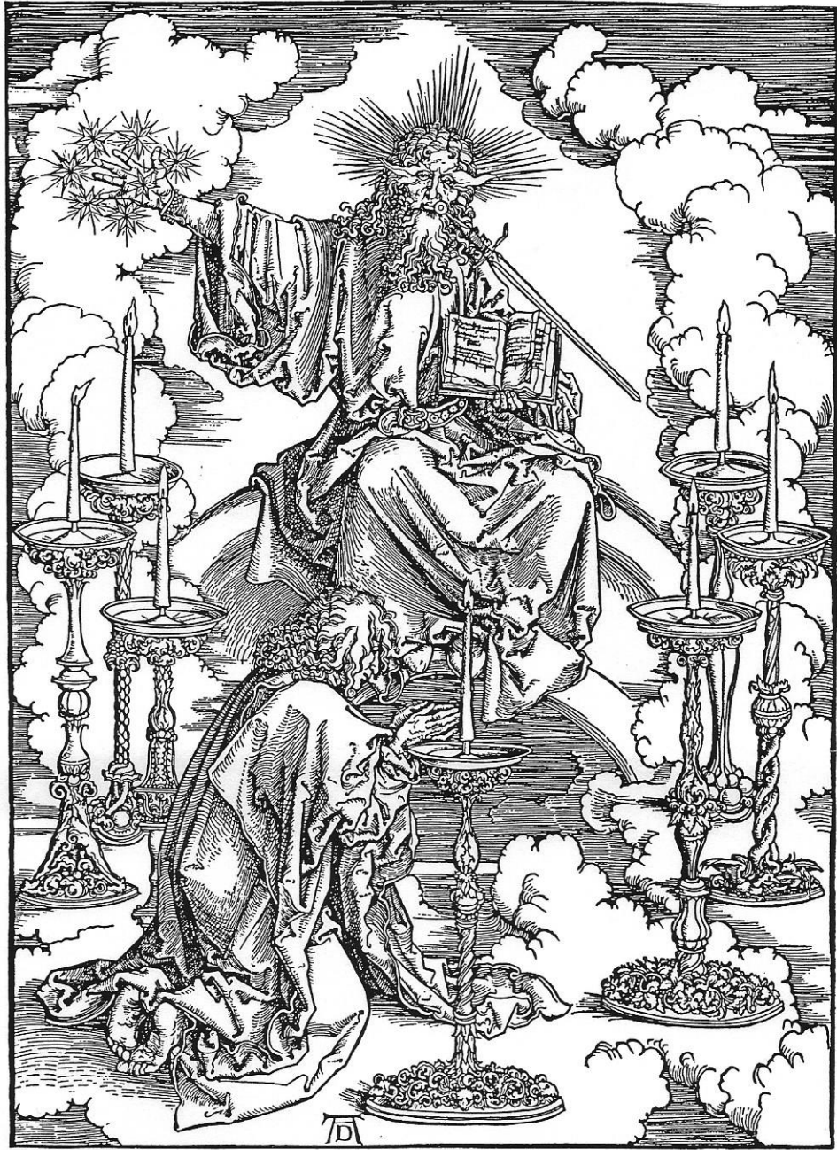
Fig. 12.1 Scenes from Dürer's "Apocalypse" #1

ຮູບພາບໝາຍເລກ 1 ເປັນຮູບພາບນິມິດແລກຂອງທ່ານໂຢຮັນ (ພນ ບົດທີ່ 1) ເປັນຮູບພາບຂອງບຸດມະນຸດ (ພຣະເຢຊູຄຣິສ) ຊຶ່ງເຄື່ອງຢ່າງສົມພຣະກຽດ ຖ້າມາກາງເຄື່ອງຮອງຕົນໂຄມທອງຄໍາເຈັດອັນ ພຣະຫັດກ້າຂວາຂອງພຣະອົງຊຶ່ງຖືດາວເຈັດດວງ ມີພຣະແສງສອງຄົມອອກມາຈາກພຣະໂອດແລະພຣະພັກຂອງພຣະອົງເຫມືອນດັ່ງດວງອາທິດທີ່ສ່ອງແສງກ້າ ທ່ານໂຢຮັນກໍມີລົງຂາບແທບພຣະບາດຂອງພຣະອົງ