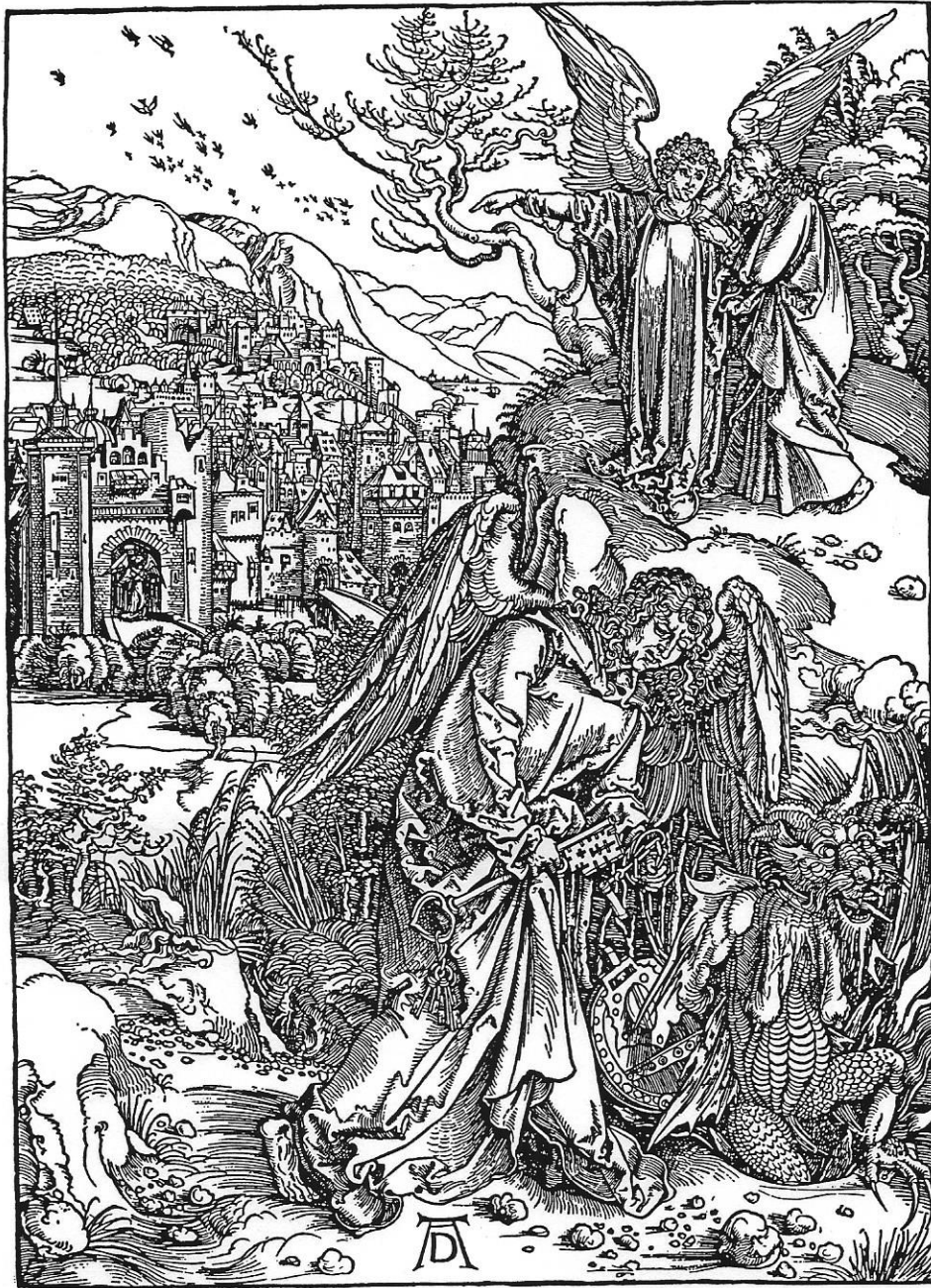
Fig. 12.4 Scenes from Dürer's "Apocalypse" #15

ຮູບພາບໝາຍເລກ 15 ຮູບພາບສຸດທ້າຍນີ້ ຄວາມຊົ່ວຮ້າຍຖືກທຳລາຍ ທູດສ່ວນມິຖີຂໍກະແຈ ແລະໂສ້ຄຸມຂັງພະຍາມານ ແລະທູດອີກອົງນຶ່ງຊື່ໃຫ້ທ່ານໂຢຣັນເຫັນກຸງເຢຣູຊາເລັມໃຫມ່ ທີ່ຜູ້ຊອບທັມຈະ ຢູ່ຢ່າງສັນຕິສຸກ (ພນ 20:1-3, ບິດທິ 21)