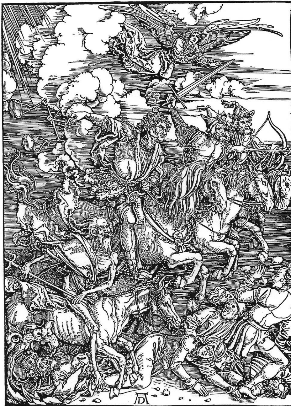
Fig. 12.2 Scenes from Dürer's "Apocalypse" #4

ຮູບພາບໝາຍເລກ 4 ແປັນຮູບພາບຜູ້ທີ່ຂີ່ມ້າທັງສີ່ ແປັນຮູບທີ່ມີຊື່ສຽງ ທ່ານໄດ້ບັນລະຍາຍຕາມ ໃນພຣະທັມພຣະນິມິດບົດທີ 6 ຮຽງຕາມລຳດັບຈາກຂວາມືມາທາງຊ້າຍມື ທີ່ໝາຍເຖິງຊັຍຊະນະ ແສິກ ສິງຄາມ ຄວາມອິດຢາກ ແລະຄວາມຕາຍ